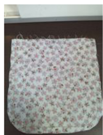
(1) 本体内布を中表にしてU字に縫う