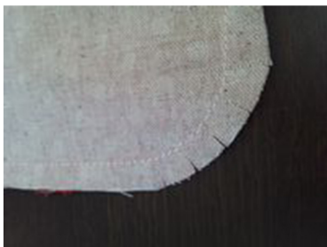
(4) カーブのぬいしろに切り込みを入れる