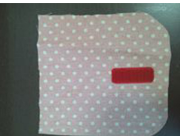
(1) フタ後ろ布の中央下部分に マジックテープを縫いつける