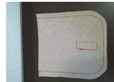
(3) フタの表布と後ろ布を中表 にして重ね、U字に縫う