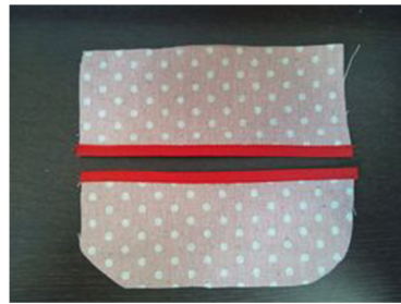
(2) ティッシュ口になる部分に バイアステープを縫いつける