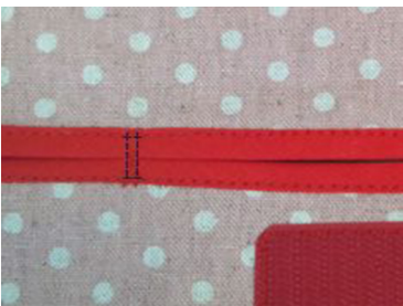
(4) ティッシュ口中央から左右 5cmのところをたてに返 し縫いする（ティッシュが 出すぎないようにするため）