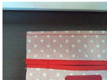
(5) ポケットの入り口を三ツ折 にして縫う