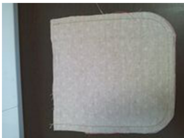
(7) (6)と中表になるように本体後ろ布を重ねてU字に縫う