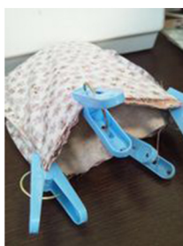
(2) (1)に袋同士が中表になるようにして本体を入れ込む