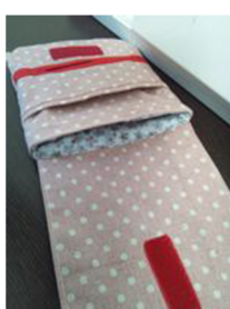
(5) 返し口を閉じるのも兼ねて、口を一周ステッチする