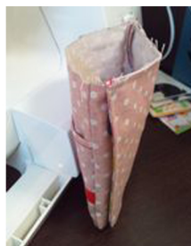
(10) (9)にフタの表が内側になるように重ねて、本体後ろにぬいしろ0.5cmで縫いつける