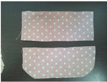
(1) ポケットを半分にカットする