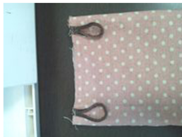
(9) 本体後ろの上部、端から1.5cmに輪にしたひもをしつける