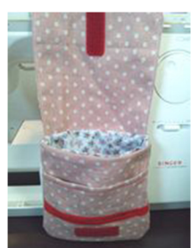
(4) 返し口から表に戻す