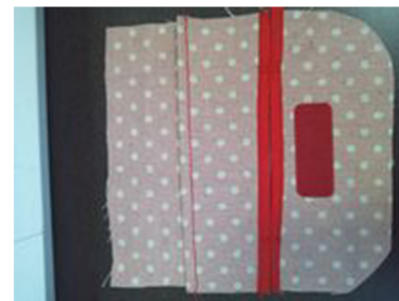
(6) 本体前布に(1)でつくったポケットを重ねる