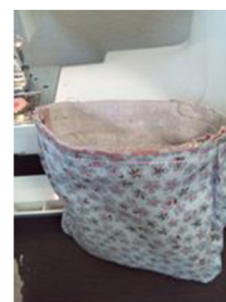
(3) フタのついていないほうに7cmの返し口を残し、ぐるっと縫い合わせる