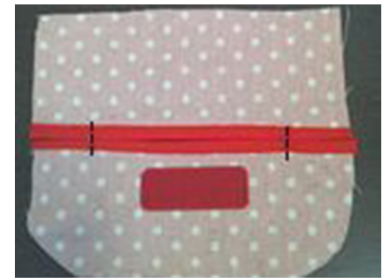
(3) バイアステープの下にマ ジックテープを縫いつける