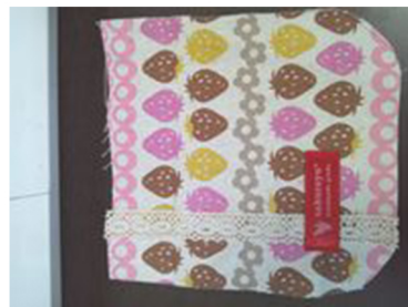
(2) フタ表布に飾りをつける場 合はここでつけておく