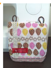
(6) ひもにクリップや持ち手をつけてできあがり!